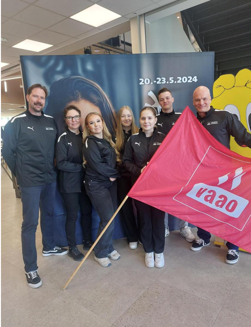
Kuopion kisajoukkue valmentajineen

Taitajakisojen toukokuun finaalissa Kuopiossa kisasivat upeat opiskelijat upein tuloksin. VAAO näkyi, kuului ja tuntui sekä menestyksen että yleisen somenäkyvyyden muodossa.