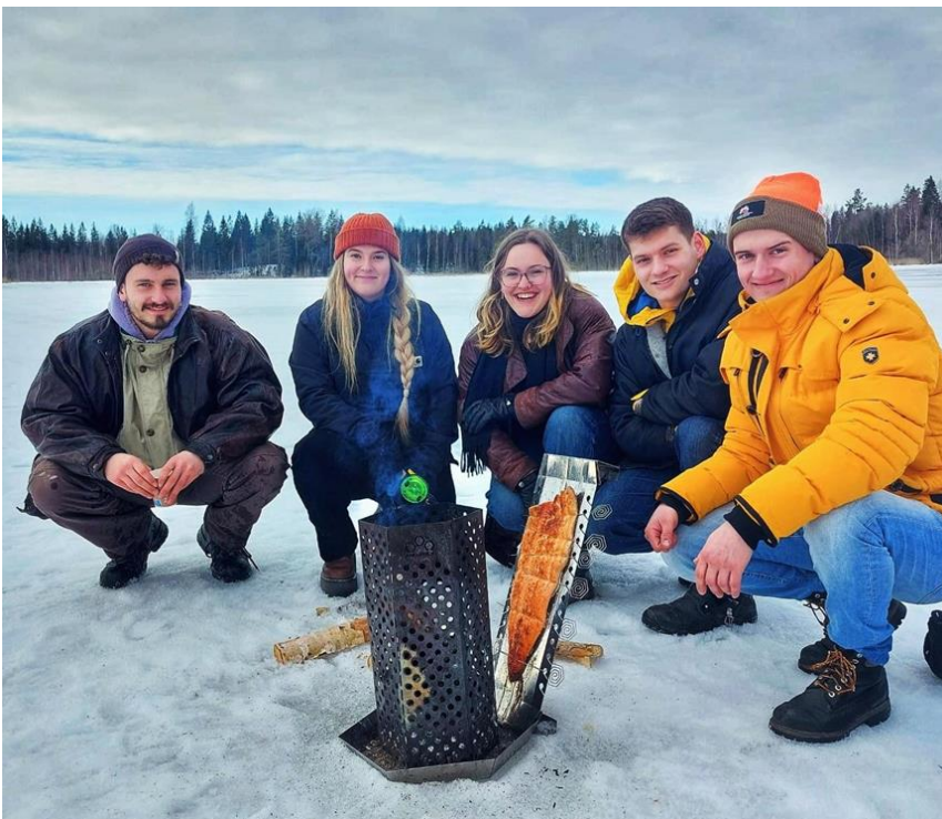
Saksalaiset puuseppäopiskelijat käynnistivät Pientalonäyttely 2024 infopisteen rakentamisen

VAAO kansallisesti arvostettu ammatillisen koulutuksen kv-toimija. Hyödynnämme laajasti Erasmus+-hankeohjelman toimintoja sekä liikkuvuus- että kumppanuushankkeissa. Liikkuvuustoiminnossa olemme akkreditoitu koulutuksenjärjestäjä, mikä tarkoittaa taattua rahoitusta opiskelija- ja henkilöstöliikkuvuuksiin koko hankeohjelmakauden 2021–2027 ajan. Aktiivisimmat kumppanuudet kv-toiminnassa suuntautuvat Saksaan, Sloveniaan, Italiaan ja Espanjaan. Lisäksi kumppanuuksia on solmittu Hollantiin, Viroon, Latviaan, Tšekkeihin ja Ranskaan. Parhailleen on meneillään kaksi kumppanuushanketta, joiden teemat liittyvät liikuntaan, hyvinvointiin, vapaaehtoistyöhön sekä tekniikkaan. Opiskelija- ja henkilöstöliikkuvuuksien määrät ovat palanneet lähes korona-aikaa edeltävälle tasolle, ja kiinnostus liikkuvuusjaksoihin on tällä hetkellä korkealla tasolla.