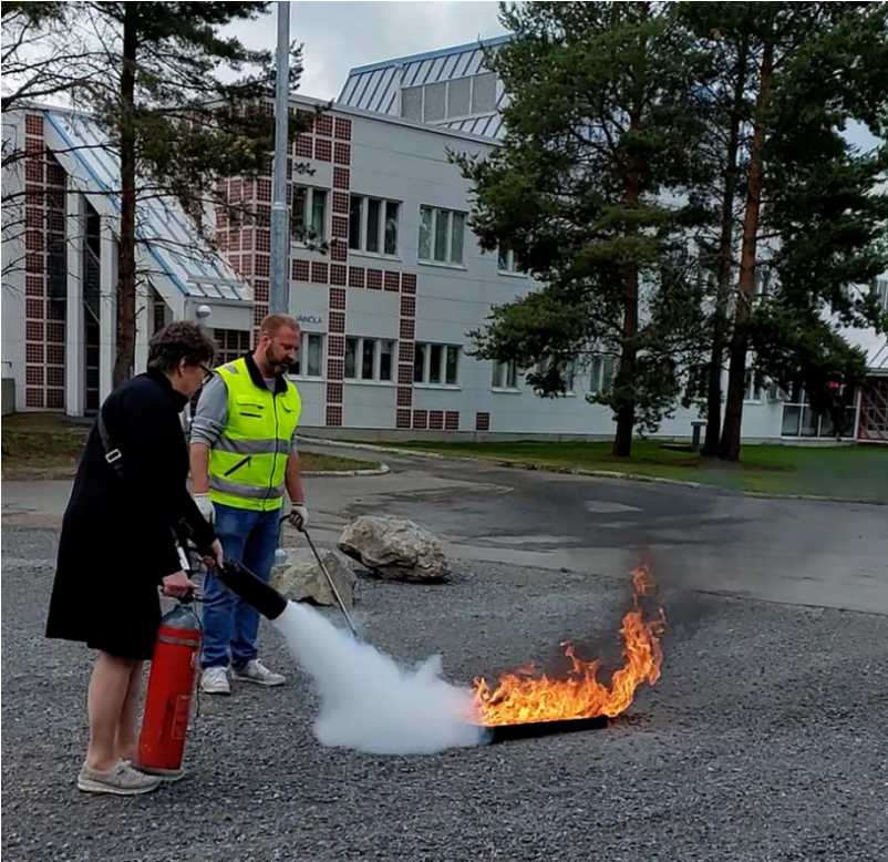
VAAOn henkilökunta suoritti alkusammutuskurssin kesällä. Kuvassa suoritusta tekemässä apulaisrehtori