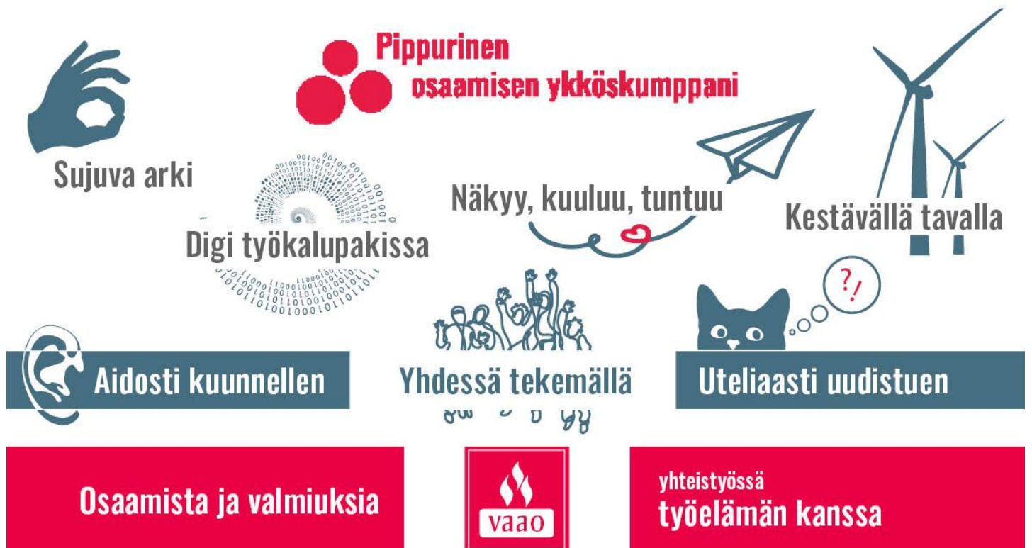
Kuva: VAAOn perustehtävä, arvot, strategiset päämäärät ja visio vuodelle 2025.

Raimo Alarova kuntayhtymäjohtaja/rehtori